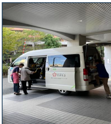
添乗員が乗車介助を行います