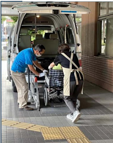
介護スタッフと一緒に車いすごとリフトで乗車します。