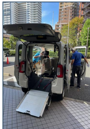
乗車前の点検は欠かせません