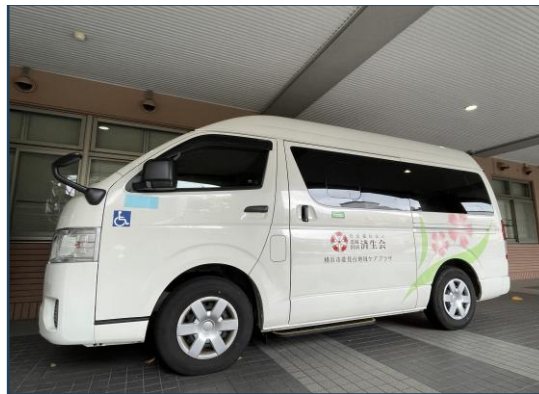
済生会のなでしこマークが目印です