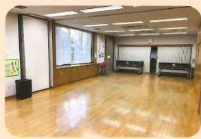
多目的ホール （定員50名程度）