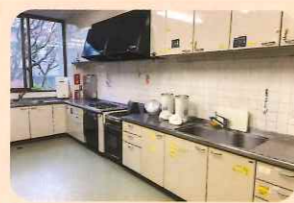
調理室 （多目的ホールと隣り合っており、一体的な利用が可能）