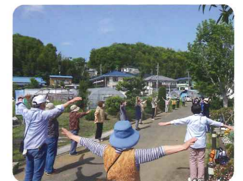
砂田川沿いで「あお盆」を楽しむ様子

住み慣れた地域で暮らし続けられるように、地域とのつながり、日常の生活を支える仕組みづくりをお手伝いしています。高齢者一人ひとりができることを大切にしながら、地域住民から専門職まであらゆる立場の人が手を取り合い、生活支援や介護予防、社会参加が充実した地域づくりを進めます。