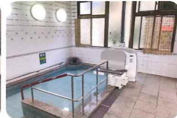
清潔で明るい浴室 車椅子の方も、リフト浴で安全に入浴