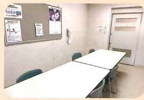
地域ケアルーム （定員10名程度）

地域の皆さまの福祉・保健活動や交流の場として、お部屋の貸し出しを行っています。ご利用の際は、あらかじめ団体登録が必要となります。