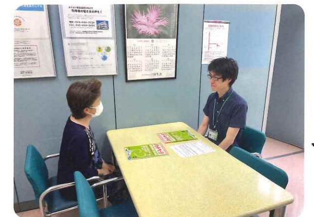
プライバシーに配慮した相談室