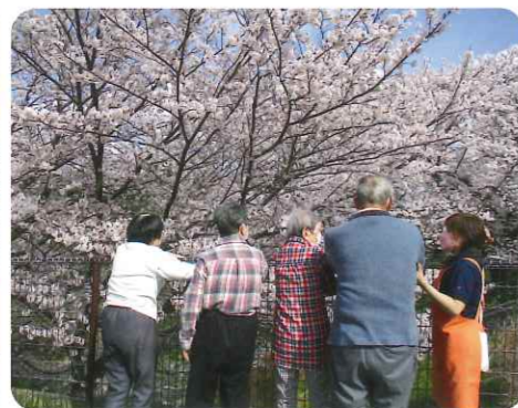
地域の特性を活かしたレクリエーション