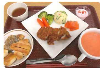
手作りの美味しい食事