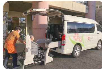
福祉車両でご自宅まで伺い送迎

要介護（支援）認定を受けられた方を対象に、食事や入浴、健康チェック、機能訓練などのサービスを提供しています。