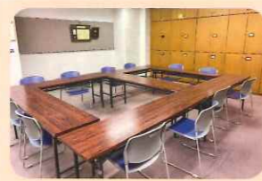
ボランティアルーム （定員18名程度）