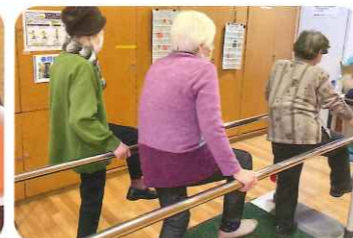
明るく開放的なダイニングで 楽しみながら体力維持・向上