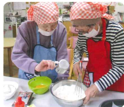
アットホームな空間で、一人ひとりに寄り添ったサービスを提供

要介護認定を受けられた認知症の方を対象に、少人数（一日10名の定員）で、個々に合わせた機能訓練やレクリエーションを提供しています。